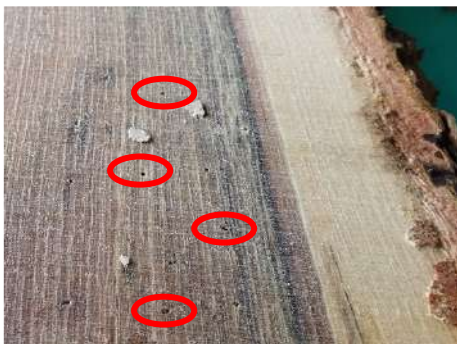
(写真：赤丸の小さな穴が虫による被害)