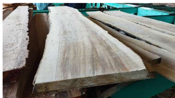
(写真：虫などの被害がない綺麗な材)