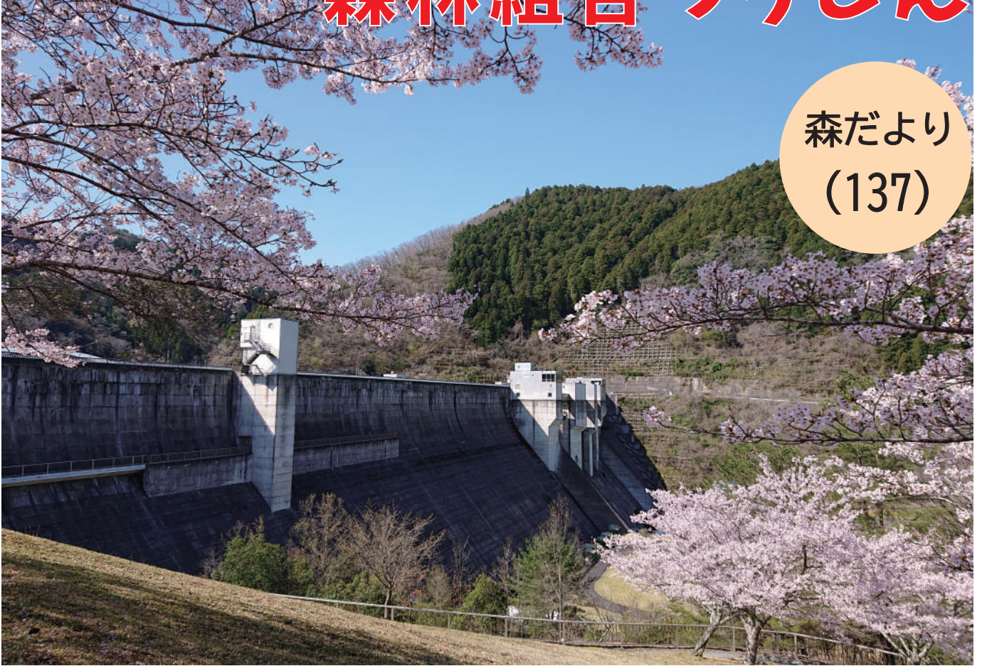
写真：桜と日吉ダム